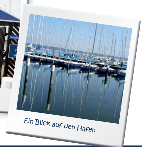
Ein Blick auf den Hafen