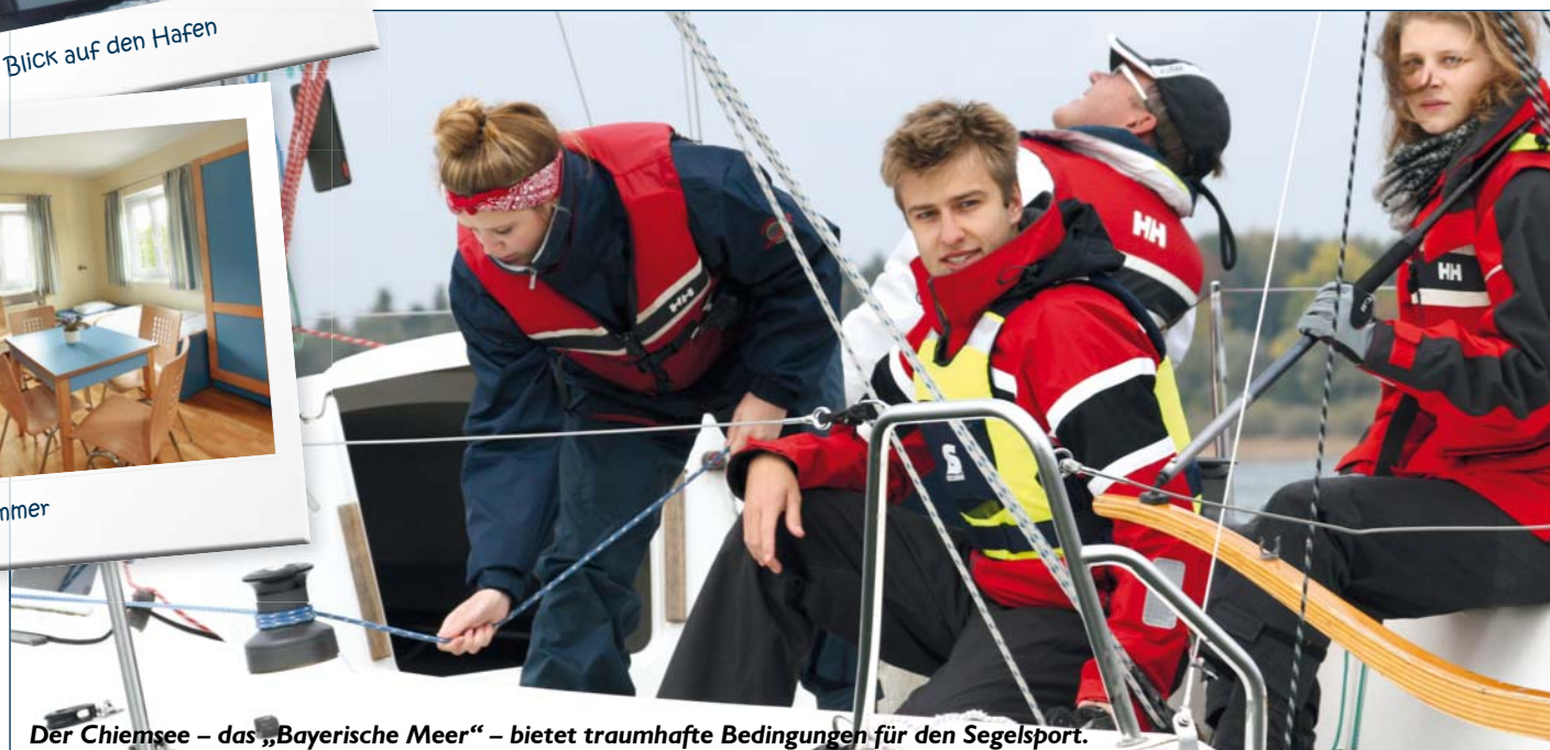
Der Chiemsee – das „Bayerische Meer“ – bietet traumhafte Bedingungen für den Segelsport.