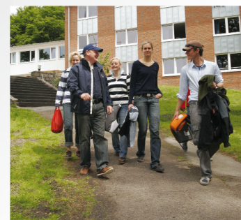
Auf zum Segeln